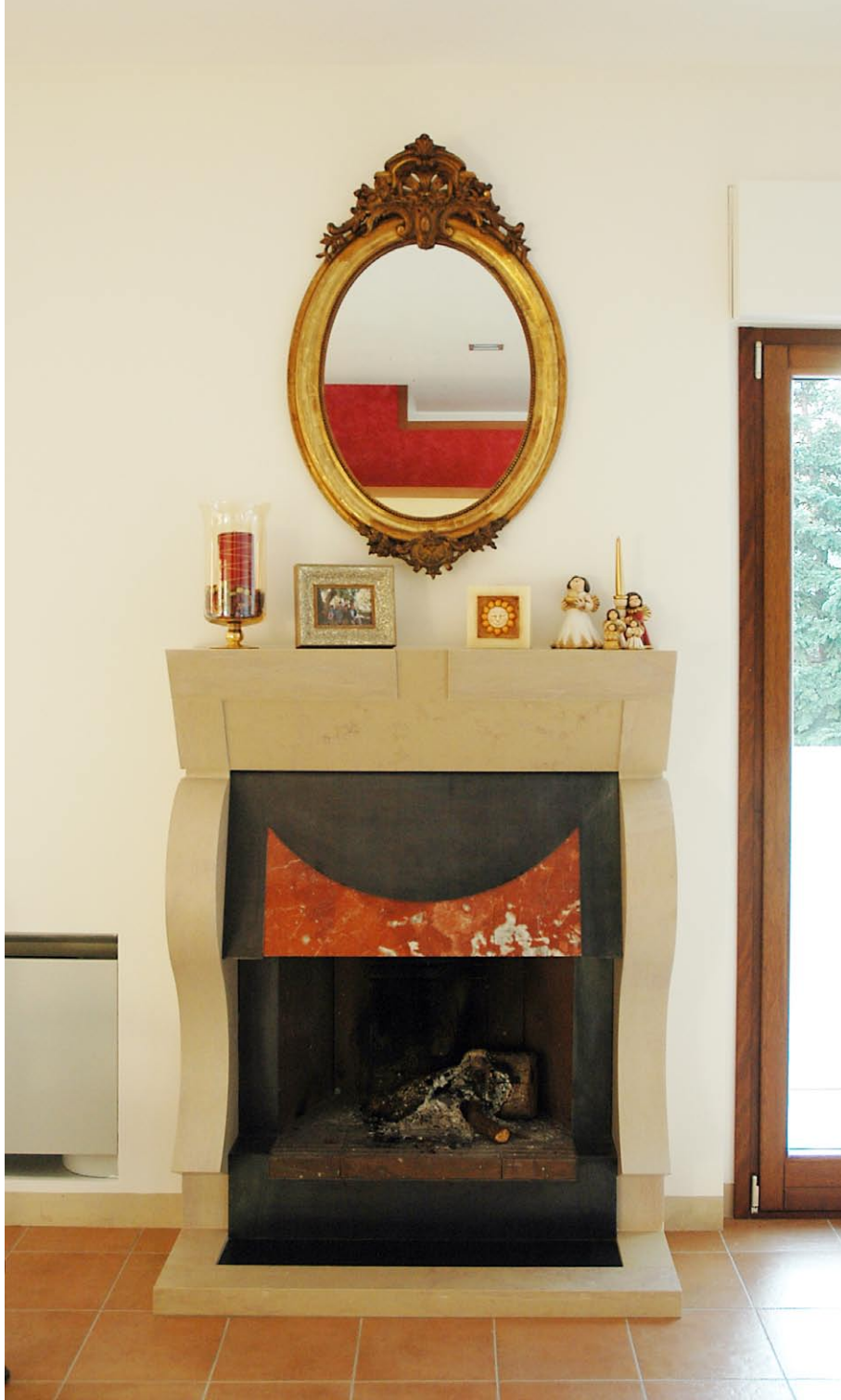
Casa Antonietta e Angelo Dinota 3, 4, camino in acciaio e pietra 5, dettaglio della partenza delle scale 6, portone d'ingresso 7, ingresso visto dal soggiorno